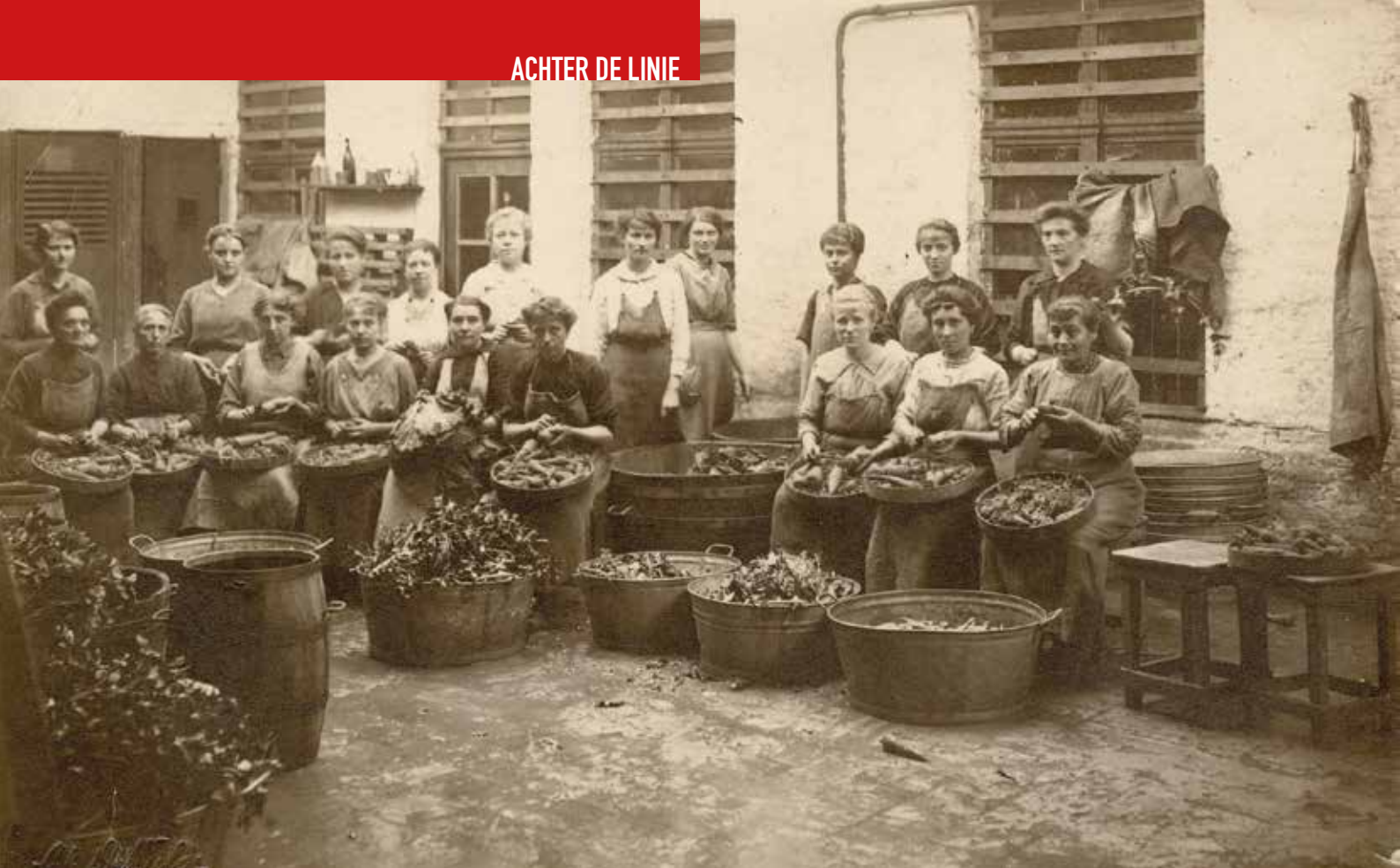
Vrouwen aan het werk in een volkskeuken aan de Hoogpoort in Gent tijdens de Eerste Wereldoorlog.