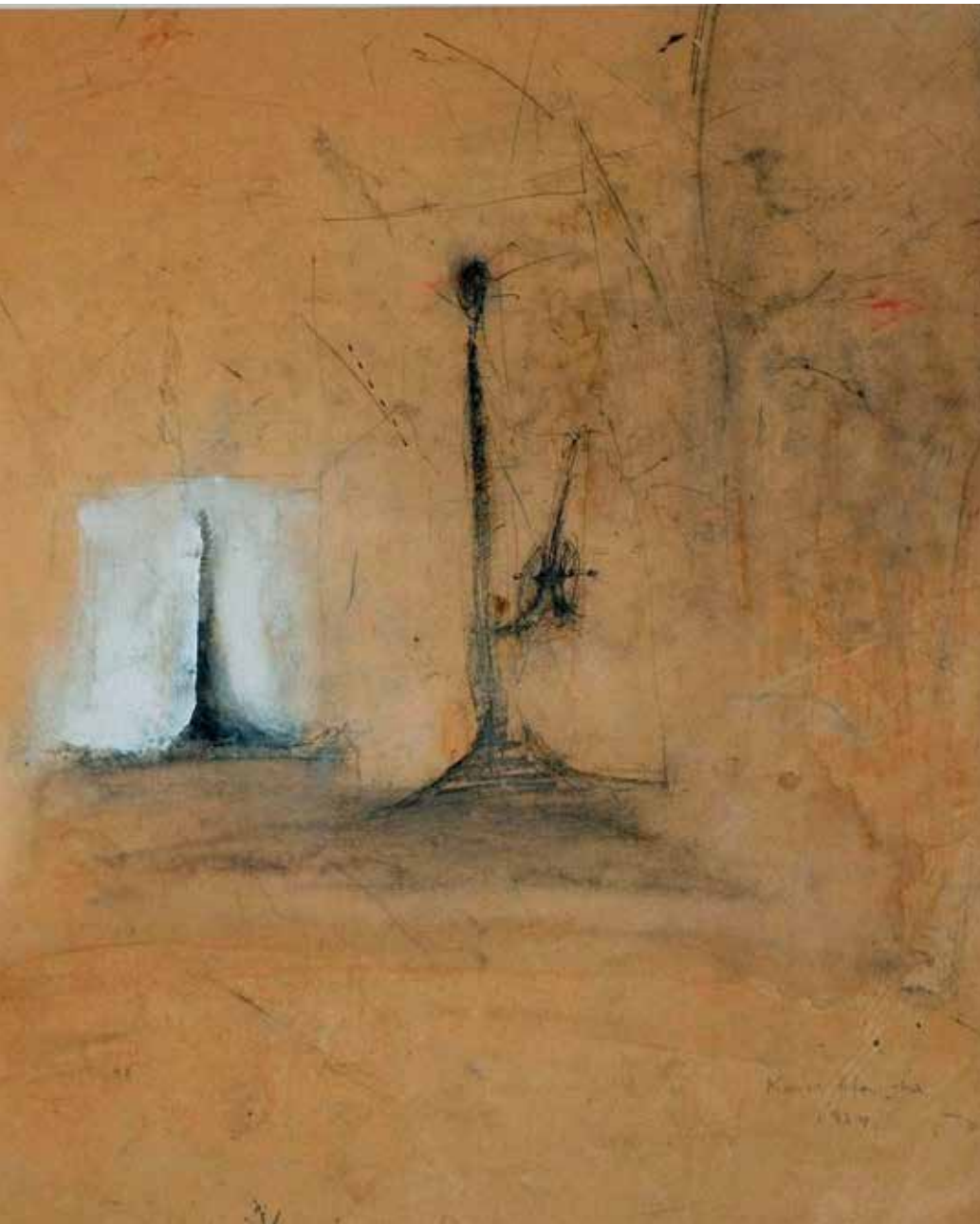
Karel Dierickx: 'The Thames at Chiswick', 1984, gemengde techniek op karton, 41.5 x 33.5 cm.