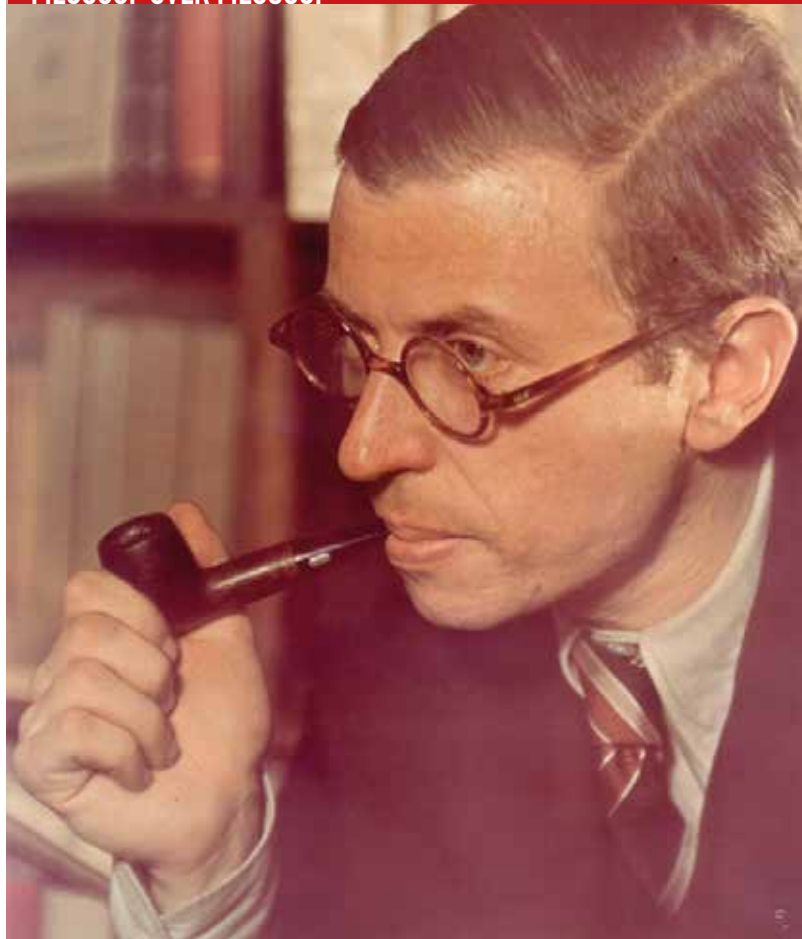
Jean-Paul Sartre (1905 - 1980)

Aangezien Sartre stelt dat de mens is veroordeeld tot vrijheid, dringt zich de vraag op waartoe die vrijheid dient. Met andere woorden, wat is de zin van het leven? Zeker wanneer