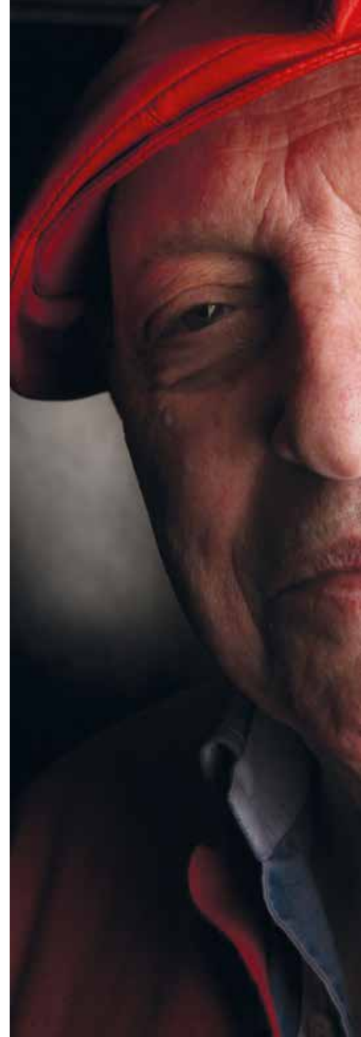
De in de leegte – hoe overvol ook – starende mens, van de medemens en zijn omgeving, is de levenslange

Er zijn kunstenaars die zich afvragen of we wel zien wat we zien. Zijn er geen verbanden die aan onze kennis ontsnappen? Kan de rationaliteit zomaar alles in mooi afgebakende vakjes stoppen? Is de logica wel de alleenheersende wet van het menselijk handelen? Streeft de mens naar verlichting, of is dat één van de vele illusies waarmee hij zijn angst voor het duistere onbekende versluiert? Deze kunstenaars suggereren dus onvermoede en zelfs sociaal ongewenste