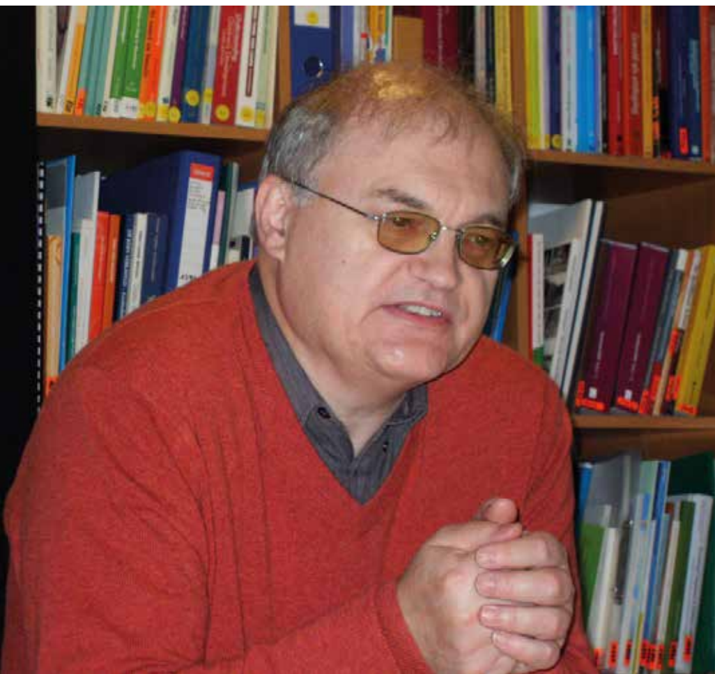
Jean Pierre Verhaeghe © Fred Braeckman

realiseren, dan moet de overheid voor bijkomende capaciteit of scholen zorgen of voor vervoer naar scholen met een gelijkaardig aanbod waar wel nog plaats is. Met voorrangregels kun je dat niet oplossen.