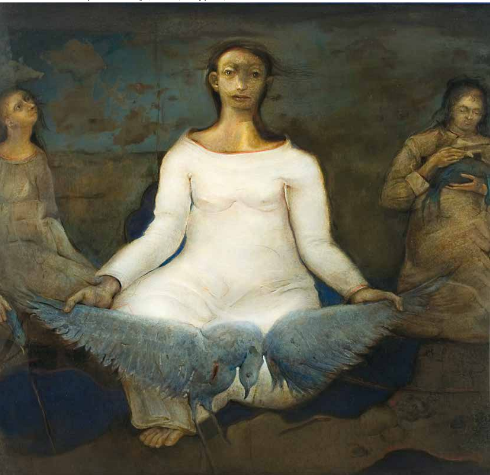
Octave Landuyt: 'De blauwe vogel', 1940-'46, olie op paneel, 1m20 x 1m65

doorgaans open, maar toch verstomd blijft. Wie of wat zijn deze onwezenlijke wezens? De in de leegte – hoe overvol ook – starende mens, vertwijfeld over de (on)zin van het leven, vervreemd van de medemens en zijn omgeving, is de levenslange thematiek van Landuyt. Hierin sluit hij zich zoals velen van zijn generatie aan bij het existentialisme van Sartre, voor wie thema's zoals angst en wanhoop,