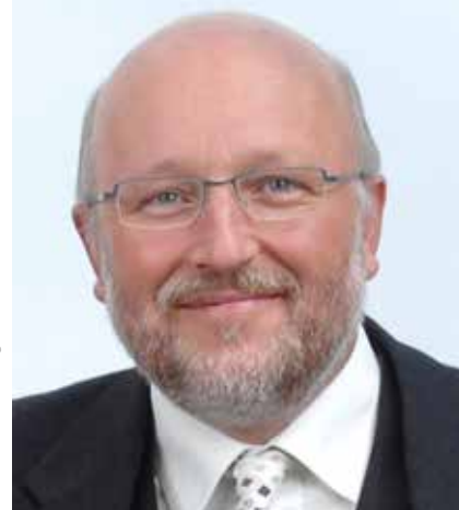
© Met toestemming van de auteur

Dat de publieke zorg om goed onderwijs is losgekoppeld van de rol van de scholen zelf, is één van de beste zaken die ons onderwijs kon overkomen. Hier ligt de basis voor de hoge kwaliteit van ons onderwijs: een evenwicht tussen een goed uitgebouwde publieke verantwoordelijkheid en grote schoolautonomie. De marktwerking heeft een brede variëteit aan scholen opgeleverd, van elite Jezuietencolleges tot vooruitstrevende athenea, stedelijke buurtscholen en alternatieve methodescholen. Wij hebben zowat het meest veelkleurige scholenlandschap in Europa. Een diversiteit die voor ouders een reële keuzevrijheid oplevert. Progressieven en vrijzinnigen maken hiervan zelf ook dankbaar gebruik door hun kinderen te sturen naar die scholen die het best bij hun opvoedingsvisie aanleunen. Dat kunnen GO-scholen zijn, stedelijke methodescholen, of voor niet weinigen ook katholieke scholen.