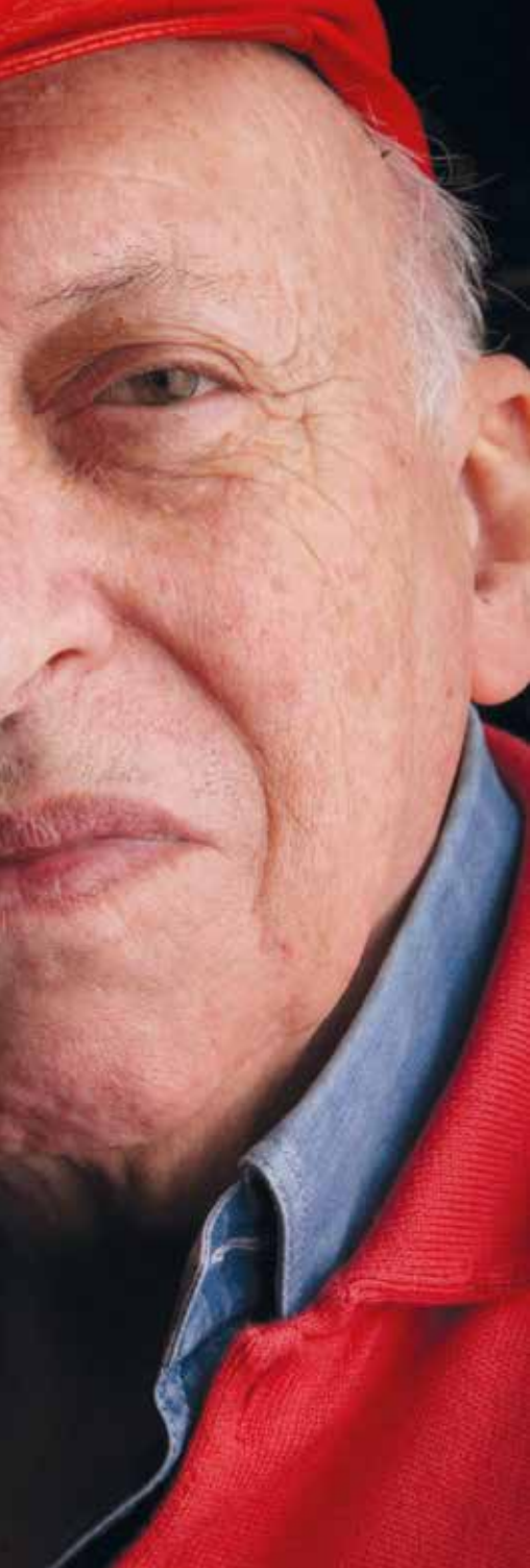
ertwijfeld over de (on)zin van het leven, vervreemd e thematiek van Landuyt.

waarheden, de sprookjes – verboden voor kinderen – in hun meest vunzige versies, de geheimen van de natuur, de nog ongeboorte genetische varianten die we misbaksels noemen, draken en gedrochten. Kortom, alles wat we uit ons hoofd zetten wanneer we tussen twee prikklokbeurten door, verkleed in maatpak, onze taak voor het dagelijks brood vervullen. Al heeft internet hier een uitweg geboden.