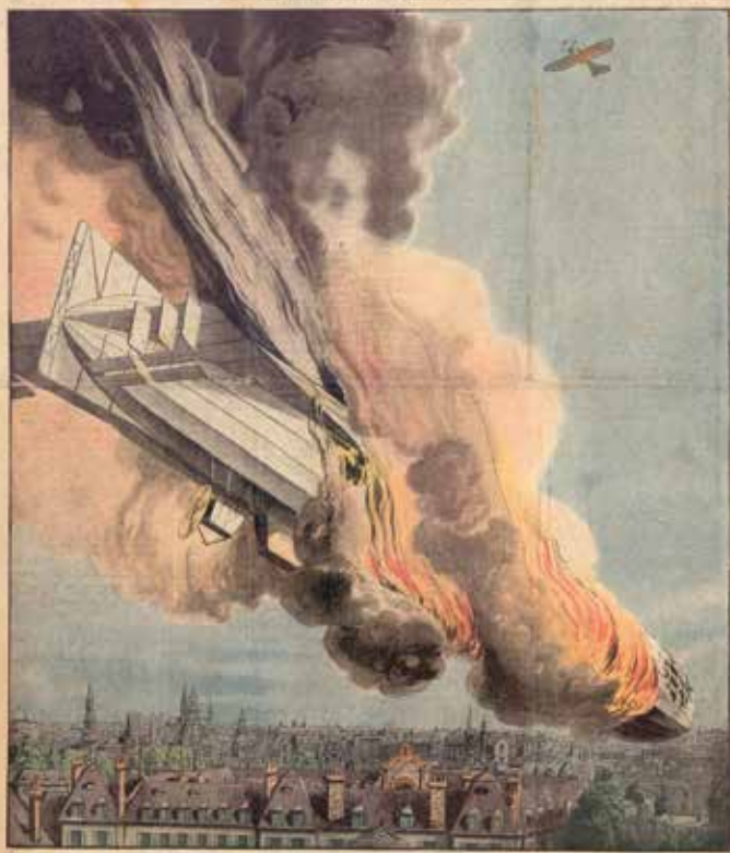
LE ZEPPELIN ABATTU