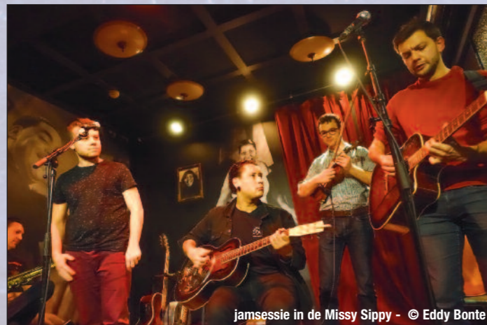
jamsessie in de Missy Sippy