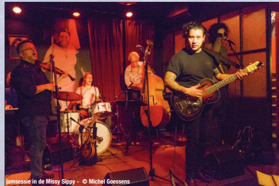
jamsessie in de Missy Sippy

gasten voor hun 'Sunday Sessions' en ook liefhebbers van Americana komen met een maandelijkse jam onder leiding van Leander Vandereecken (zie portret) aan hun trekken.