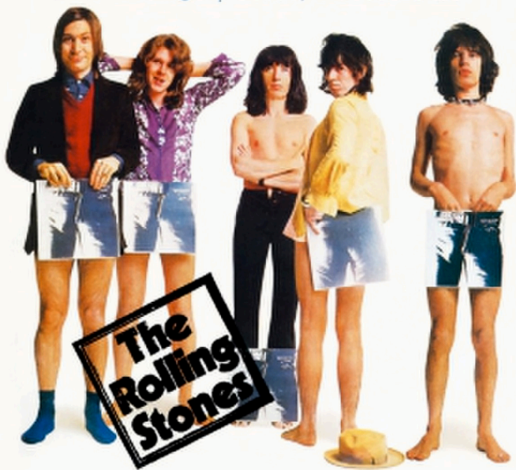
Cover van de single Brown Sugar .

De Stones zingen inderdaad over een seriemoordenaar die om middernacht toeslaat. Je moet het de Stones vooral zien uitbeelden, want op scène hangt Jagger met overtuiging de sadistische vrouwenmoordenaar uit. Op een bepaald ogenblik zit hij op zijn knieën, trekt de riem uit zijn broek en slaat ermee op de grond, het gesyncopeerde ritme volgend. De Midnight Rambler is een pure sadist, 'the hit-and-run raper in anger, the knife-sharpened tippie-toe, or just the shoot 'em dead brainbell jangler', ja een 'proud black panther' die iedereen te snel af is ('I'll steal your mistress from under your nose').